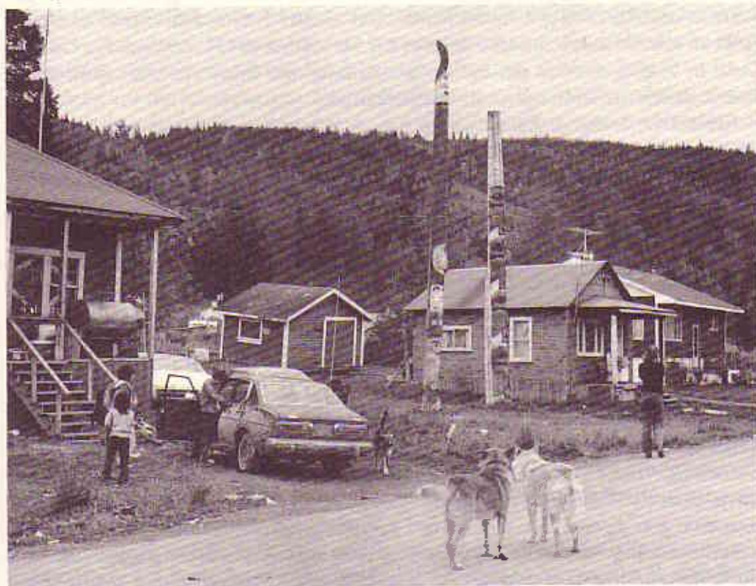
Totempfähle an der Nordwestküste heute

Das Totemtier war nicht tabu. Das heißt, man durfte das Tier der eigenen Totemgruppe unter Umständen töten. Das Tier starb ja nicht wirklich, sein Geist und seine Kraft waren immer in mythischer Weise präsent und wurden in den Zeremonien der großen Winterfeste immer wieder durch Erzählungen, Gesänge, Tanz und schamanistische Riten beschworen. Die heute vorhandenen Totempfähle stammen fast alle aus dem 19. Jahrhundert. Erst die von den Weißen