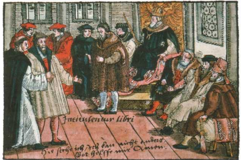
Luther in Worms

Dies wieder organisatorische Realität werden zu lassen: das ist Kirchenreform, Reformatio als Wiederherstellung der ursprünglichen und echten Gestalt der Kirche. Der Weg Martin Luthers und der anderen Reformatoren war die Säkularisierung: die Verweltlichung der Kirche.