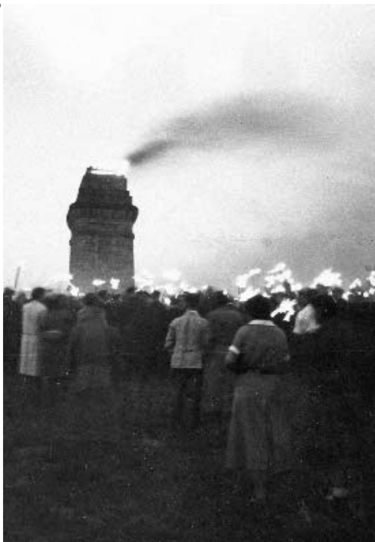
In den Anfangsjahren des Uni-Bundes gehörte die Teilnahme an den Sonnenwendfeiern am Bismarckturm zu den Höhepunkten der Jahreshauptversammlungen.

Anfangsjahren wieder aufzunehmen: „Ich bin aber sehr dafür, die Hauptversammlung wieder mit der Sonnenwendfeier zu verbinden, denn die letztere hat nach meinen Beobachtungen stets in besonderem Mass auf die Teilnehmer gewirkt.“ Trotzdem fand die Hauptversammlung in den Jahren zwischen 1928 und 1933 nicht zur Sonnenwendfeier statt, da die Termine entweder mit dem geplanten Programm der Hauptversammlung kollidierten oder einige Vorstandsmitglieder an den entsprechenden Wochenenden verhindert waren.