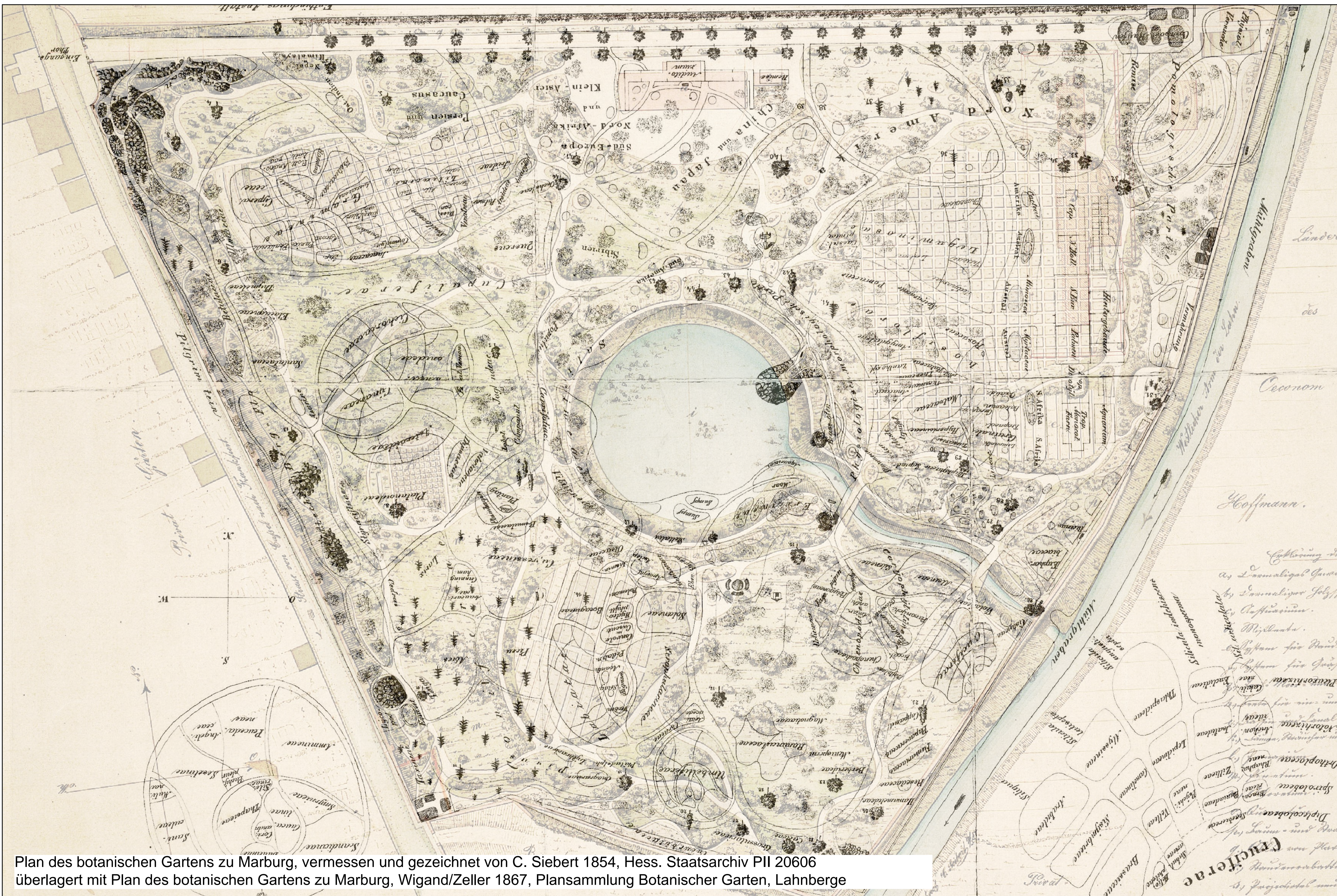
Plan des botanischen Gartens zu Marburg, vermessen und gezeichnet von C. Siebert 1854, Hess. Staatsarchiv PII 20606 überlagert mit Plan des botanischen Gartens zu Marburg, Wigand/Zeller 1867, Plansammlung Botanischer Garten, Lahnberge