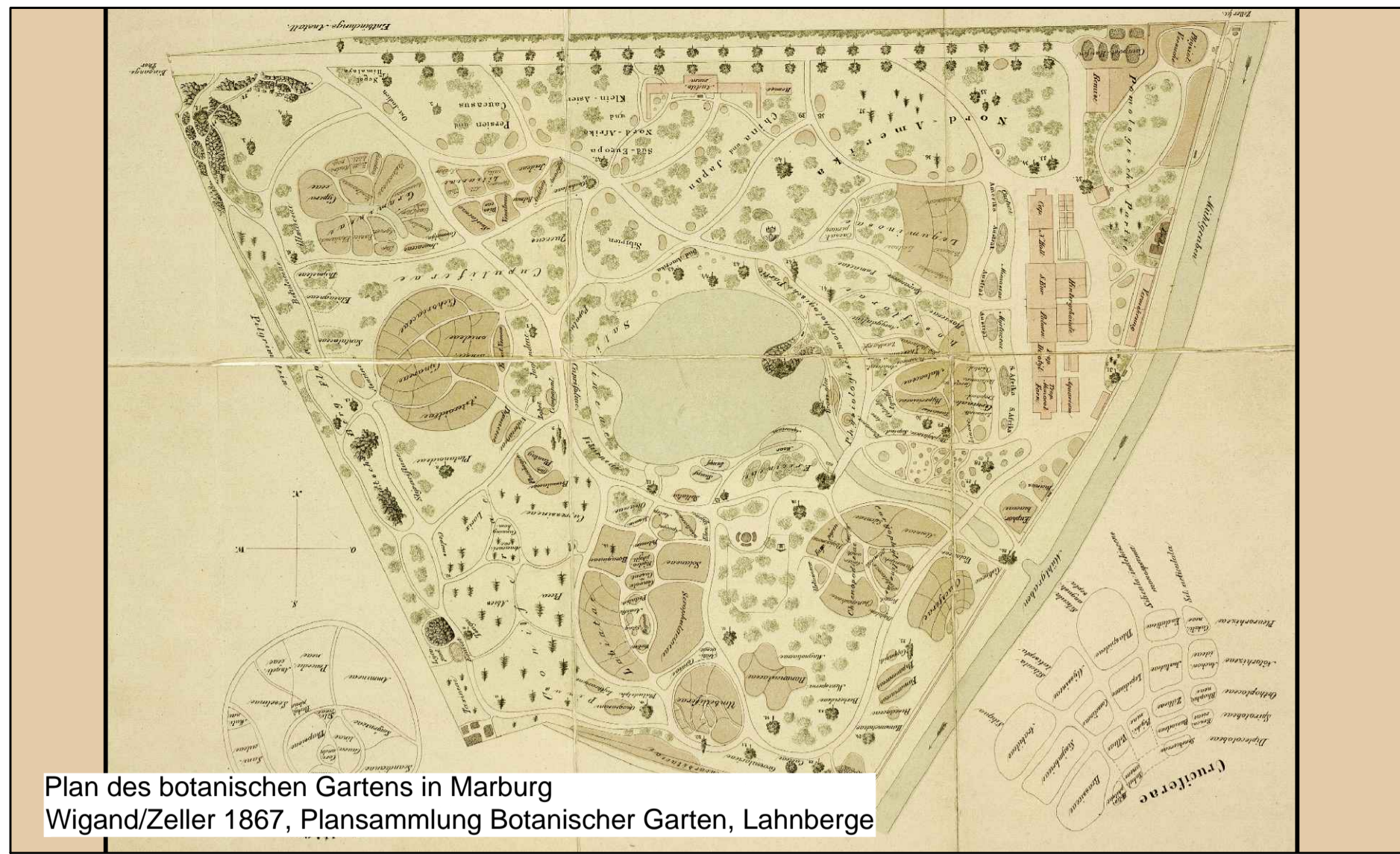
Plan des botanischen Gartens in Marburg Wigand/Zeller 1867, Plansammlung Botanischer Garten, Lahnberge