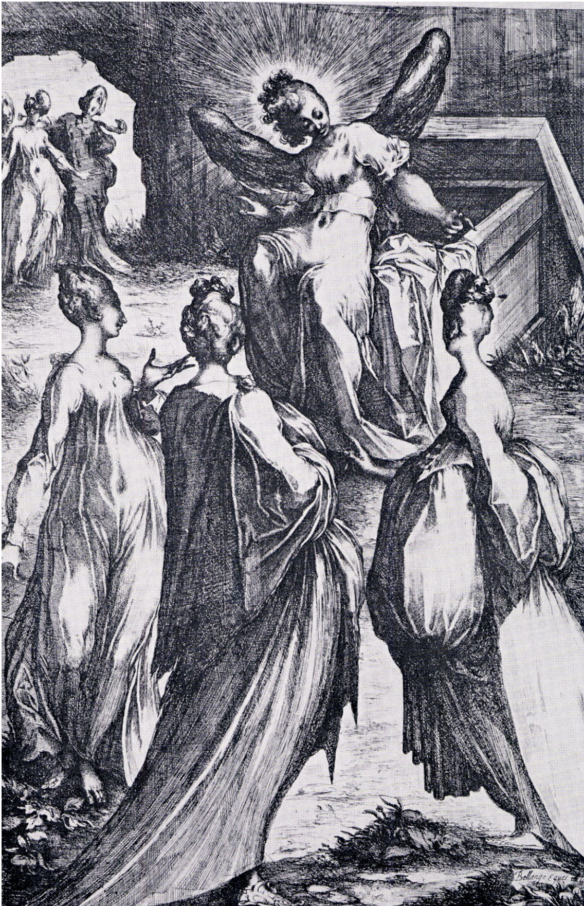
Abb.5c: Jacques Bellange (1575-1616), Die drei Marien am Grabe, Kupferstich, Webeintrag 2019