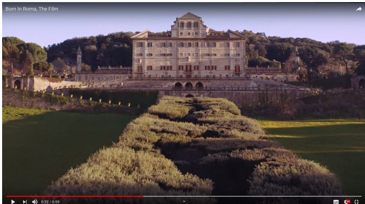
Abb.3: Villa Aldobrandini (Frascati, 1598-1603, Giacomo della Porta u.a.), Standbild aus: Born in Roma, Produktwerbung (Videoclip), Webeintrag 2019.

Eine Erneuerung und Erweiterung der politischen Ikonographie der offenen Gesellschaft ist der Werbekampagne für „Born in Roma“ gelungen, weil sie nicht gegen den Populismus im Allgemeinen, sondern konkret gegen diese politische Tendenz in Italien adressiert ist. Die Kampagne erinnert daran, dass der Nationalismus nicht durch alternative politische Theorien allein, sondern auch durch den differenzierteren Widerpart gegen eine selbstwidersprüchliche indoktrinierende Kulturbeflissenheit überwunden wird. Den offenbar jede Rechtsbrechung rechtfertigenden, schließlich sogar tödlichen identitären Stolz auf Volk und Vaterland besiegt man schon, wenn man über einen problemorientierten Bezug zur Geschichte eines Landes verfügt und darin umfassender ist als das autoritäre nationalistische Grenzwächtertum.