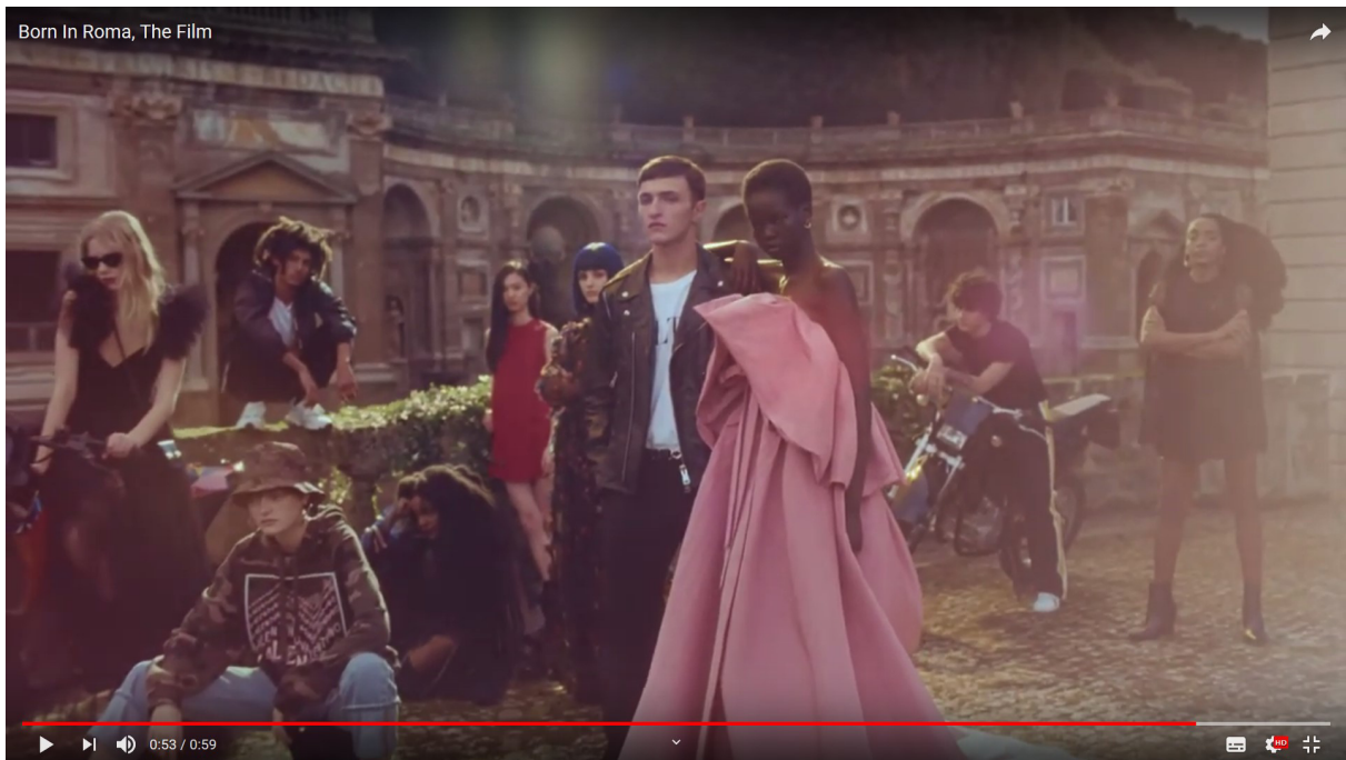
Abb.2: Born in Roma, Produktwerbung (Videoclip, Standfoto), Webeintrag 2019.

Modehauses zum ersten Mal durch eine Schwarze verkörpert wird. 1 So ist auch der von Piccioli ins Bild gebrachte mondäne Kosmopolitismus keine originäre Entdeckung der Werbewelt. „Born in Roma“ nimmt vielmehr eine Ästhetik der großen Stadt als „melting pot“ von Ethnien, Schichten und Stilen auf, wie sie z.B. durch Musikvideos von Madonna für das Album „Confessions on a Dancefloor“ (2005) in der Populärkultur kanonisch geworden ist. Die Kampagne heischt dabei nicht nur die Überwindung von Klassengegensätzen. Das Posing und einige Outfits der Schlossparty-Gäste im Schlussbild des Werbeclips erinnern auch an Avatare oder Charaktere in Computerspielen ( Abb.2 ).