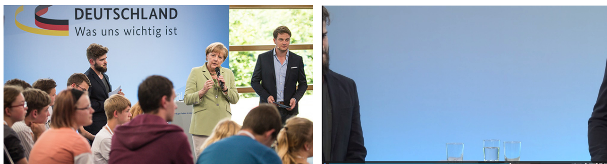
Abb.1a+b: „Bürgerdialog“ mit Angela Merkel, Rostock, 15. Juli 2015, TV-Übertragung, Standfotos.

Am 15. Juli 2015 kam es während der TV-Übertragung eines „Bürgerdialogs“ u.a. über Migrationspolitik mit Bundeskanzlerin Angela Merkel in Rostock zu einem denkwürdigen Bild der „Flüchtlingskrise“ ( Abb.1a+b ). Gewiss ist darüber bisher in noch keinem Beitrag zur Bildgeschichte und politischen Ikonologie der „Flüchtlingskrise“ berichtet und diskutiert worden. Zu sehr wurde es durch einen anderen, unmittelbar darauf folgenden und besonders stark beachteten bildlichen Moment überdeckt.