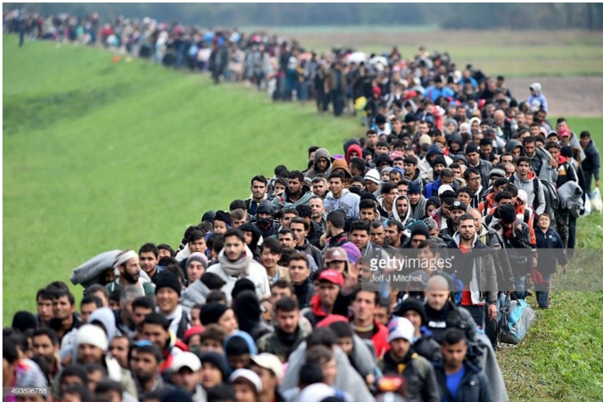
Abb.7: Jeff J. Mitchell, Flüchtende auf der „Westbalkanrouter“ in Slowenien , Fotografie, 2015, © Getty Images.

Kein anderes Beispiel zeigt diesen Vorgang deutlicher als die missbräuchliche Verwendung eines Fotos der Westbalkanroute in Slowenien im Herbst 2015 von Jeff Mitchell ( Abb.7 ).