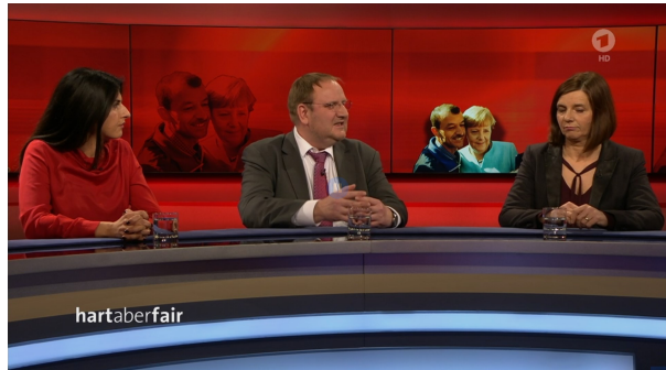
Abb.9b: „Hart aber fair“ zum Thema „Fluchtziel Europa: Was haben wir aus 2015 gelernt“ mit Katrin Göring-Eckardt (Bündnis 90/Grüne) u.a. am 09.März 2020 mit Hintersetzer eines ikonischen Fotos der „Flüchtlingskrise“, Standfoto.

In Wort und Bild sind die Ereignisse von 2015 zur Chiffre nicht der Probleme von Flüchtenden, sondern von Flüchtenden als Problem geworden ( Abb.9a+b ).