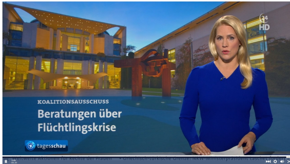
Abb.9a: „Tagesschau“ mit Judith Rakers am 08.März 2020 mit Hintersetzer zur „Flüchtlingskrise“, Standfoto.