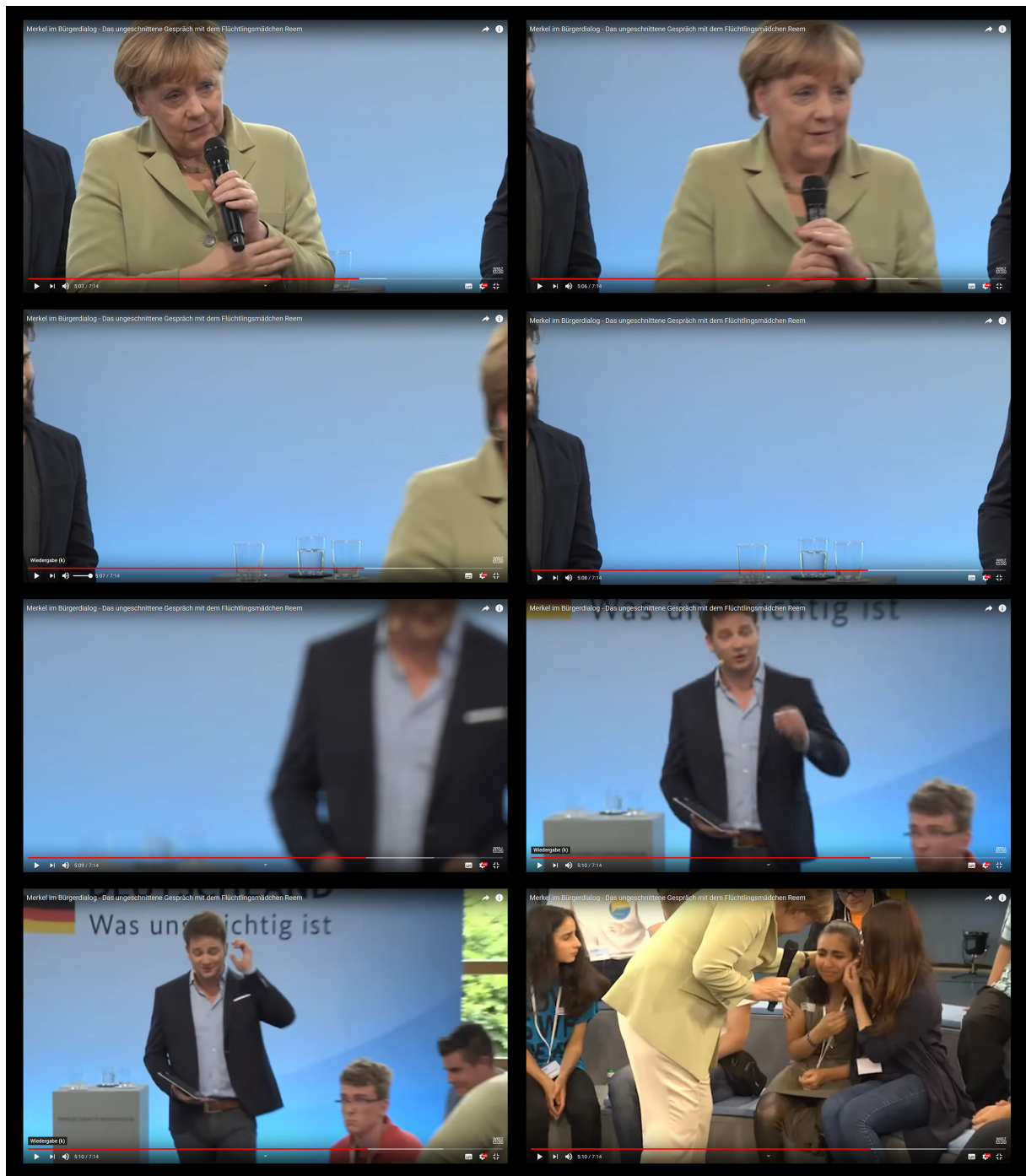
Abb.2: „Bürgerdialog“ mit Angela Merkel und Reem Sahwii, Rostock, 15.Juli 2015, TV-Übertragung, Standfotos.

verweigert und ist buchstäblich aus dem Rahmen gefallen. Das Bild ist das Dokument eines spontanen unvorhersehbaren Ausbruchs. Würde von dem gesamten Film des Geschehens nur dieser eine Moment und dieses eine Standbild erhalten geblieben sein, würde man bereits auf einen politischen Kontext schließen können und die zwingenden äußeren und inneren Gründe für eine so entschiedene Bild-Störung in Erfahrung bringen wollen.