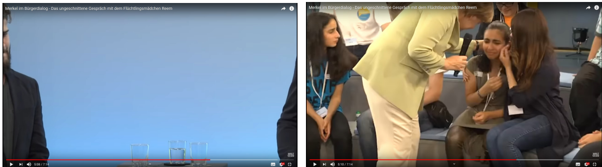
Abb.4: „Bürgerdialog“ mit Angela Merkel, Rostock, 15.Juli 2015, TV-Übertragung, Standfotos.

Historisch betrachtet ist dieser Moment so gravierend, wie er als Bild für sich betrachtet eher widersprüchlich ist und ikonologisch gesehen gegen den Augenblick des leeren, aus Mitleid und Scham verlassenen Kamerabildes wenige Sekunden zuvor sogar abfällt ( Abb.4 ). Für sich betrachtet lässt die Szene, in der sich Angela Merkel über die in sich zusammengesunkene und schluchzende Reem beugt, nichts von der politisch weitreichenden Bedeutung dieses Vorgangs ahnen. Das leere Kamerabild steht für die emanzipatorische Selbstbefreiung einer Führungspersönlichkeit, die durch eine menschliche Regung nicht mehr die Gefangene der Macht ist, die von ihr verkörperte Staatsräson moralisch in Frage zu stellen vermag und dadurch die Politik neu legitimiert. Im Gegensatz dazu hat das Bild der unmittelbaren Berührung und Nähe von Angela Merkel und Reem Sahwil hingegen fast autoritären Charakter durch die optisch übermächtige massige Wirkung des Körpers der sich zu dem Mädchen mitleidig herabbeugenden Bundeskanzlerin. Das Mädchen erscheint dadurch noch kleiner, sein Weinen könnte auch als Reaktion der Verängstigung gedeutet werden, wenn von dem gesamten Vorgang nur diese eine Szene erhalten geblieben wäre.