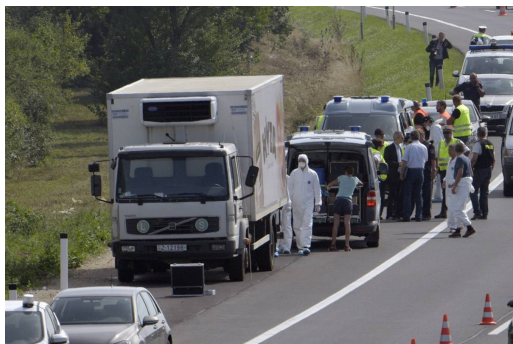
Abb.5: Parndorf, 27.August 2015, Webeintrag.

Berührende, erschütternde, eklatante oder skandalöse Begebenheiten ereigneten sich während der „Flüchtlingskrise“ ab Sommer 2015 bis zum Frühjahr 2016 beinahe wöchentlich.