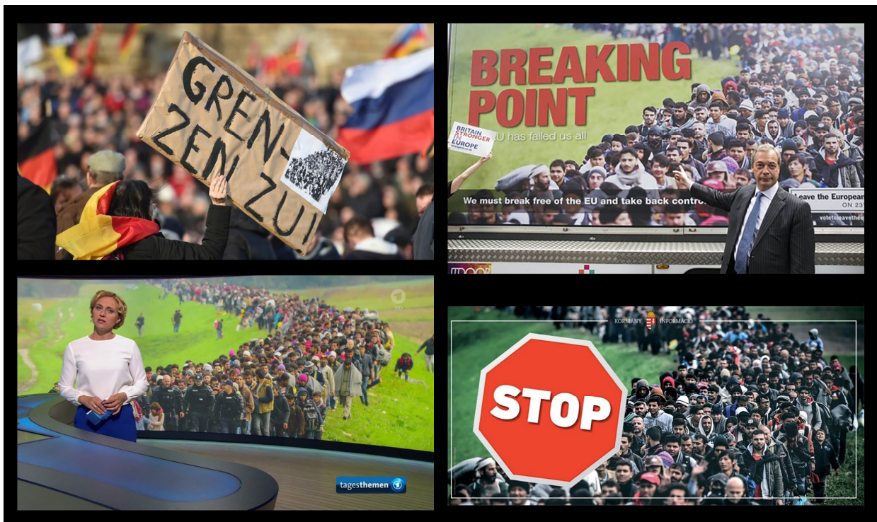
Abb.8 im Uhrzeigersinn: a) Pegida-Demonstrantin mit Plakat, 2015, Webeintrag; b) Nigel Farage mit „Breaking-Point“-Plakat, 2016, Webeintrag; c) Wahlkampfplakat der Fidesz-Partei von Victor Orban im Wahlkampf in Ungarn 2018, Webeintrag; d) „Tagesthemen“ (ARD) mit Caren Miosga, 2018, Standbild.

durch Stimmungsmache gegen Flüchtende mit einem Plakat ( Abb.8c ) auf der Grundlage der Mitchell-Fotografie aus dem Jahr 2015. Obwohl oder gerade weil es durch die Gegner der Willkommenskultur kanonisiert wurde, ist das Foto schließlich zu einem Symbolbild der „Flüchtlingskrise“ geworden, wie der Hintersetzer eines Berichts in den „Tagesthemen“ im Ersten Deutschen Fernsehen mit Caren Misoga vom 29.Mai 2018 belegt ( Abb.8d ). 3