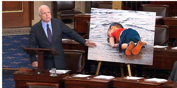
Abb.6: Senator John McCain zeigt eines der von Nilüfer Demir am 02. September 2015 aufgenommene Fotografien des ertrunkenen Aylan Kurdi am 09. September 2015 im US-Senat, Webeintrag.

Ähnlich wie der Mitschnitt des „Bürgerdialogs“ in Rostock am 15. Juli 2015 gingen auch die Bilddokumentationen dieser anderen einschneidenden, in dieser Dichte von aufrüttelnden Momenten die „Flüchtlingskrise“ kennzeichnenden Augenblicke um die Welt. Nicht nur einmal, sondern in engem Takt begab sich das, was man als ikonisches Ereignis bezeichnen könnte und jedes Mal waren diese Ereignisse und die sie dokumentierenden Bilder mit der Hoffnung verbunden, die Welt möge den Atem anhalten, die politischen Entscheider rühren und das Leiden der Migrant*innen in den Herkunftsländern und während der Flucht durch eine einvernehmliche und