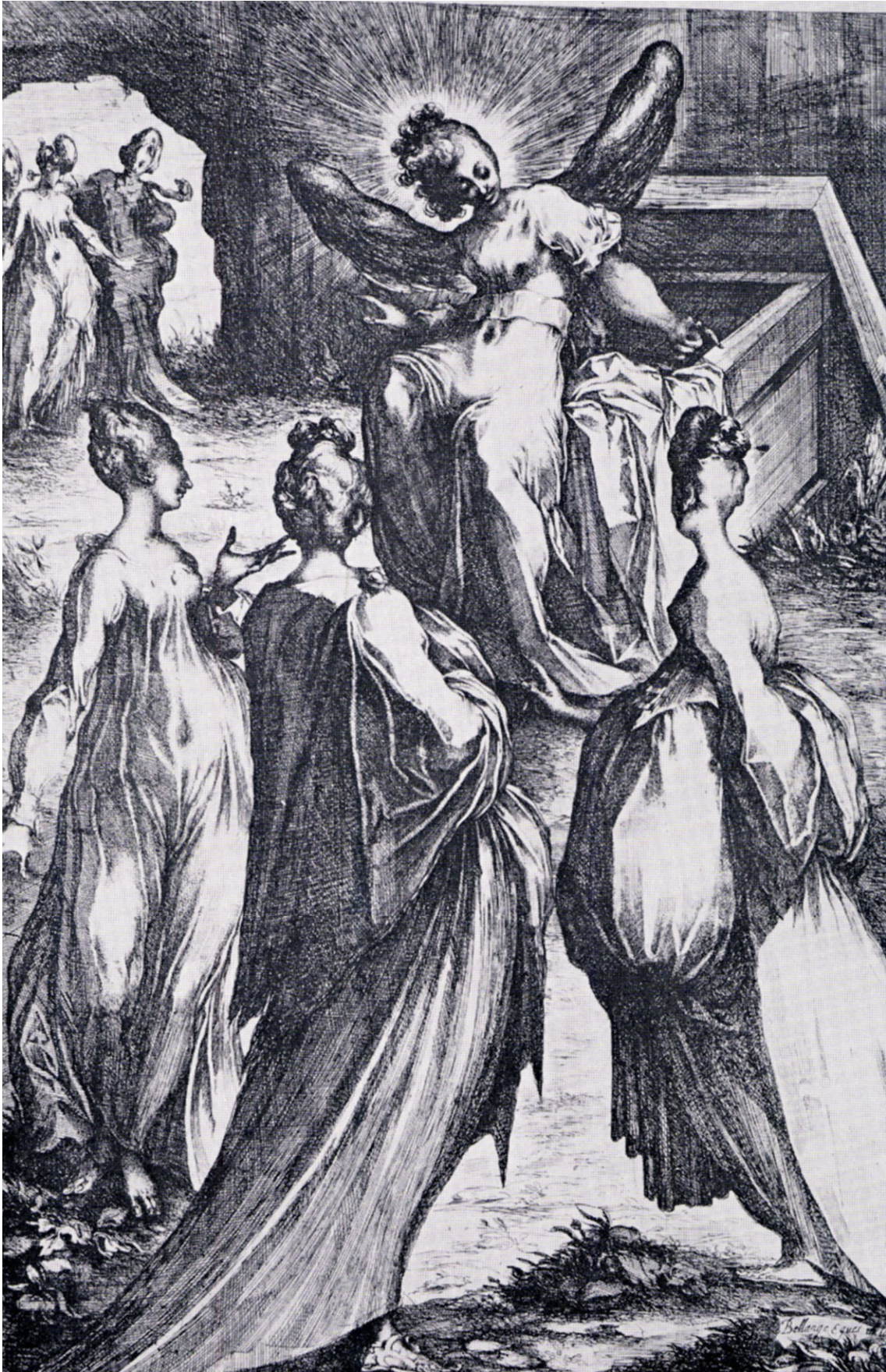
Abb.5c: Jacques Bellange (1575-1616), Die drei Marien am Grabe, Kupferstich, Webeintrag 2019