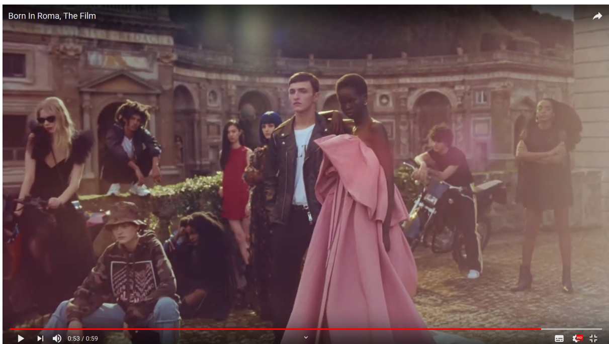
Abb.2: Born in Roma, Produktwerbung (Videoclip, Standfoto), Webeintrag 2019.

Modehauses zum ersten Mal durch eine Schwarze verkörpert wird. 1 So ist auch der von Piccioli ins Bild gebrachte mondäne Kosmopolitismus keine originäre Entdeckung der Werbewelt. „Born in Roma“ nimmt vielmehr eine Ästhetik der großen Stadt als „melting pot“ von Ethnien, Schichten und Stilen auf, wie sie z.B. durch Musikvideos von Madonna für das Album „Confessions on a Dancefloor“ (2005) in der Populärkultur kanonisch geworden ist. Die Kampagne heischt dabei nicht nur die Überwindung von Klassengegensätzen. Das Posing und einige Outfits der Schlossparty-Gäste im Schlussbild des Werbeclips erinnern auch an Avatare oder Charaktere in Computerspielen ( Abb.2 ).