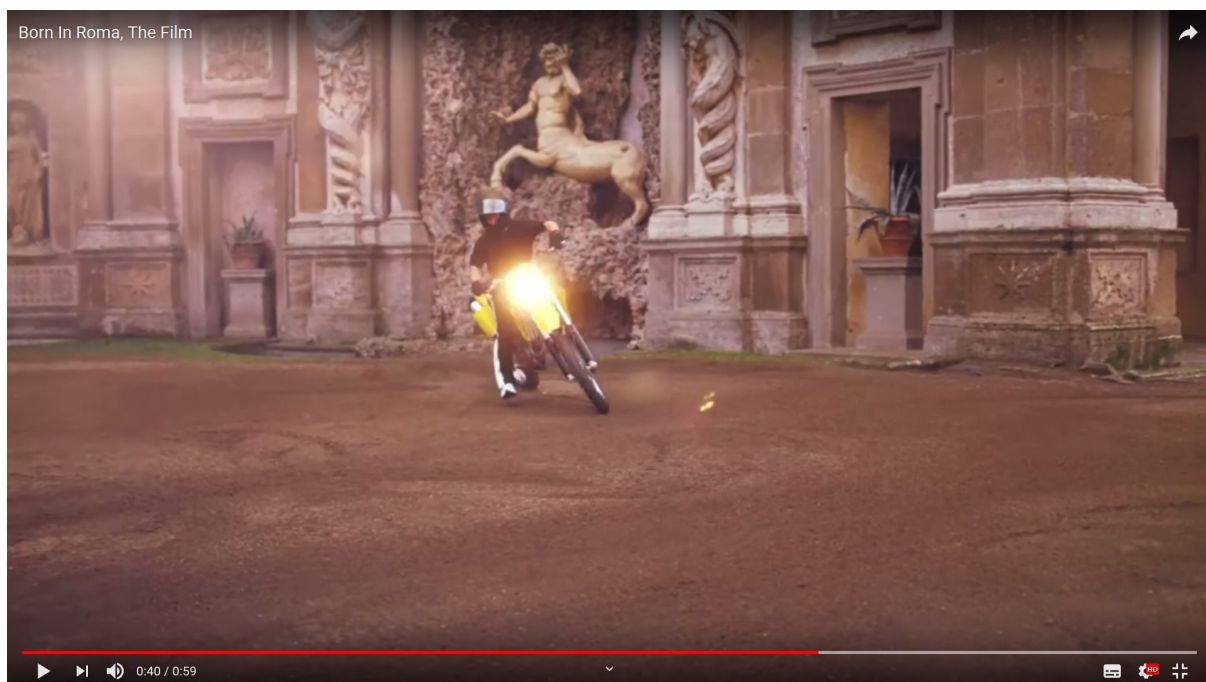
Abb.4: Motorradfahrer im Hof der Villa Aldobrandini, Standbild aus: Born in Roma , Produktwerbung (Videoclip), Webeintrag 2019.

topographischen Details ihre bildgeschichtlich kommentarwürdige neuartige Dimension. Denn in dem Werbeclip ist das Schloss als Ausflugsziel und Ort des Exils jenseits des von Populisten und Nationalisten okkupierten Rom nicht irgendein austauschbares Luxus-Etablissement. Auf den Fotos und in dem Werbefilm als beredtes Bildelement omnipräsent ( Abb.3 ), wird der Charakter und die Besonderheiten der Villa Aldobrandini in Frascati (Giacomo della Porta u.a., 1598-1603) zum Faktor der politischen Botschaft der Werbekampagne. Das programmatische universalistische, in der Zeit des Manierismus errichtete Bauwerk mit seinen komplexen Hof- und Gartenanlagen – von seinem Bauherrn Kardinal Pietro Aldobrandini (1571-1621) als „Theater des Weltarchitekten Gott“ konzipiert – wird in dem Clip zu einer Art „Hochburg“ des Cross-Over.