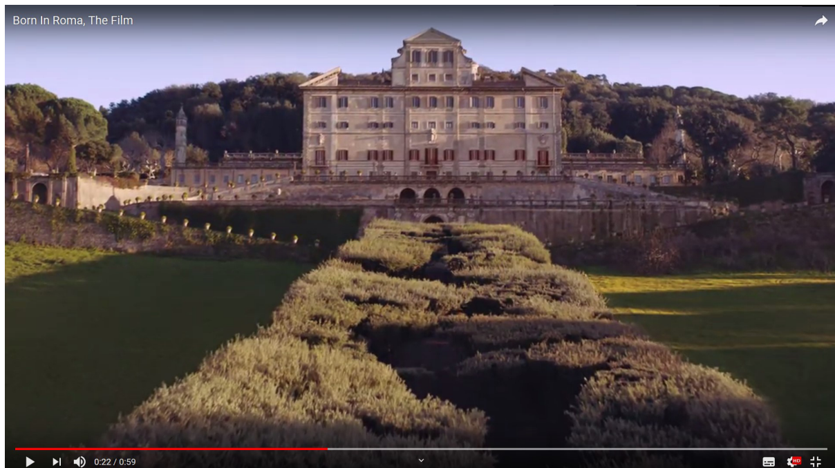
Abb.3: Villa Aldobrandini (Frascati, 1598-1603, Giacomo della Porta u.a.), Standbild aus: Born in Roma, Produktwerbung (Videoclip), Webeintrag 2019.

Eine Erneuerung und Erweiterung der politischen Ikonographie der offenen Gesellschaft ist der Werbekampagne für „Born in Roma“ gelungen, weil sie nicht gegen den Populismus im Allgemeinen, sondern konkret gegen diese politische Tendenz in Italien adressiert ist. Die Kampagne erinnert daran, dass der Nationalismus nicht durch alternative politische Theorien allein, sondern auch durch den differenzierteren Widerpart gegen eine selbstwidersprüchliche indoktrinierende Kulturbeflissenheit überwunden wird. Den offenbar jede Rechtsbrechung rechtfertigenden, schließlich sogar tödlichen identitären Stolz auf Volk und Vaterland besiegt man schon, wenn man über einen problemorientierten Bezug zur Geschichte eines Landes verfügt und darin umfassender ist als das autoritäre nationalistische Grenzwächtertum.