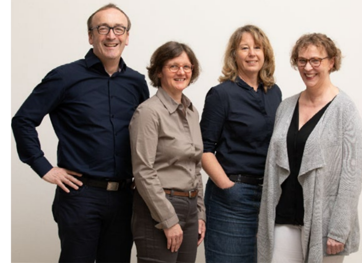
(Leitung der Psychotherapie Ambulanz)