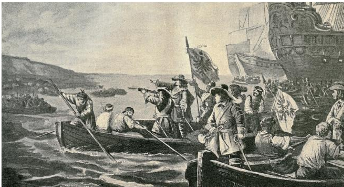
Auch nach dem Westfälischen Frieden wurde munter weiter Krieg geführt: Landung des Großen Kurfürsten auf Rügen 1678.