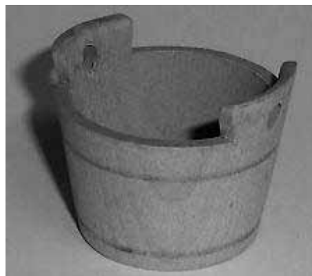
52. Zuber 'Gefäß mit zwei Handhaben'

Formen: dsūwd Gelnhshn., tsuwər Han. Großen-Linden-Gi, tsupər Birkenbringhshn.-Fk, tsovər Schlierb.-Bi Rschbg., dsowr Wtfd., tsiwr Nst.; niederdt. tovr Höringhshn.; Sg. tsovər – Pl. tsevr Grebenau-Al; Sg. u. Pl. tsuvər Nieder-Gemünden-Al. – Der Z. gehört zu einer Reihe hölzerner Gefäße ähnlicher Machart, die sich in ihrer Funktion zum Teil überschneiden;