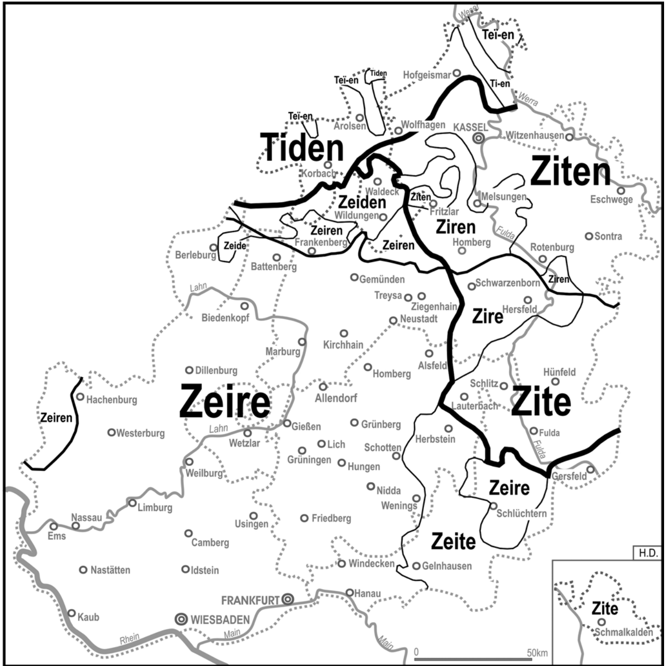
50. Zeiten (Lautgeographische Karte)