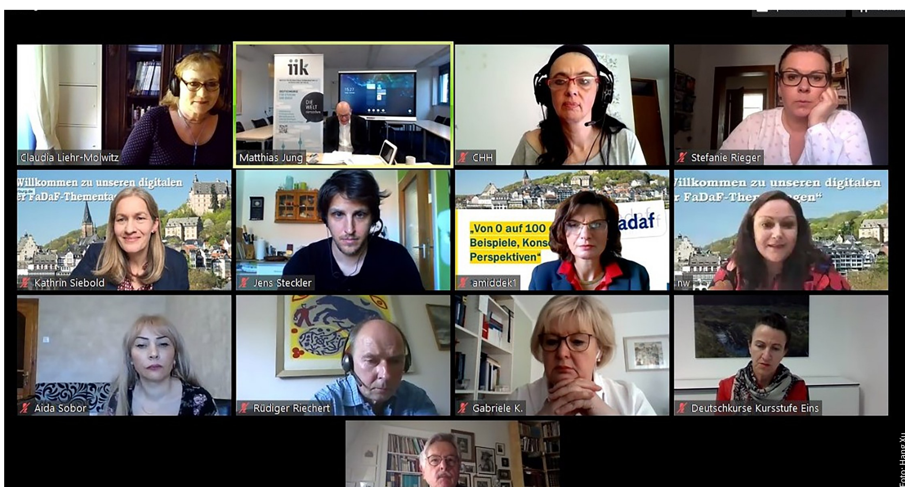
Aufgrund der Coronavirus-Pandemie trafen sich die Teilnehmerinnen und Teilnehmer nicht wie ursprünglich geplant in Marburg, sondern digital per Videokonferenz.

Fachvertreterinnen und Fachvertreter der deutschen Sprachvermittlung trafen sich virtuell zu den Digitalen Marburger FaDaF-Thementagen