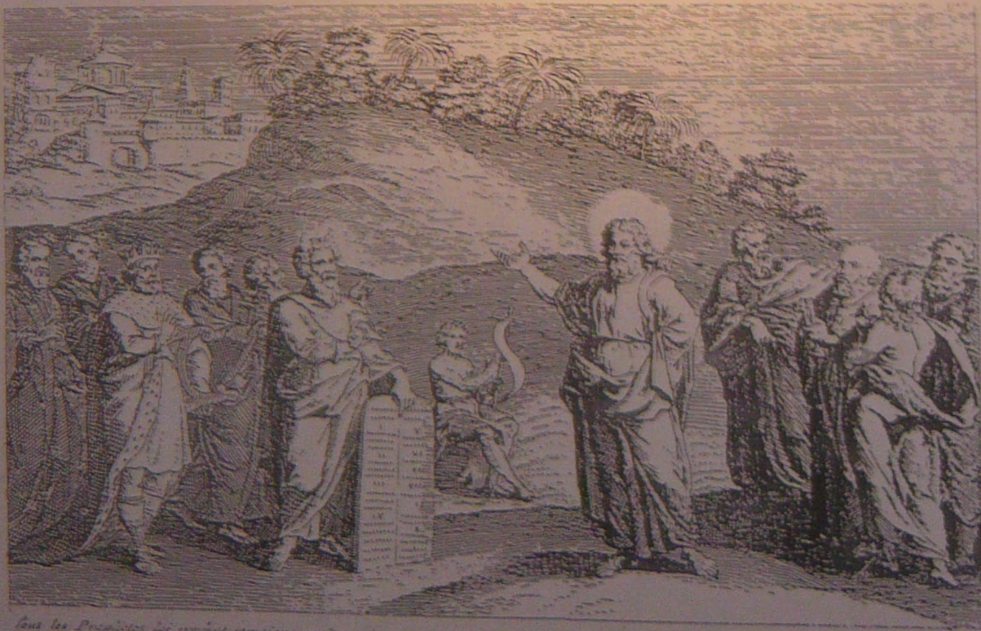
Tous les Propriétaires de ce volume ont été informés par le Ministre de la Religion de la ville de Genève, que par son ordre, les copies de ce livre ont été tirées par son ordre, le 10 Mars 1712.