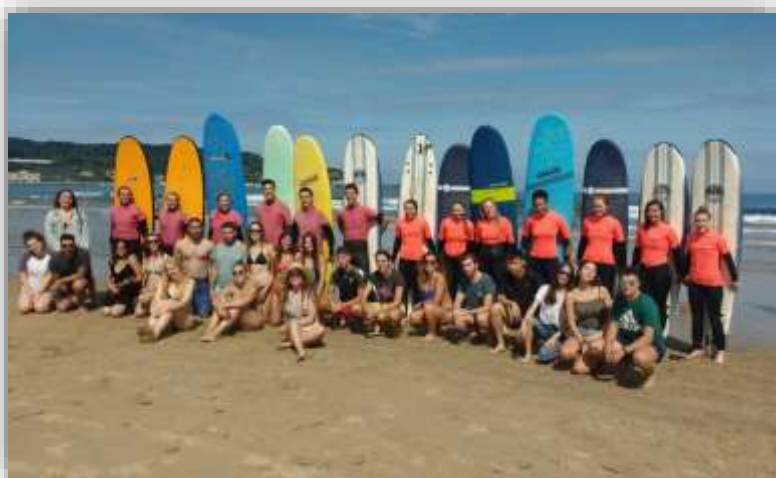
International student orientation programme - 2019

*Si votre université d'origine accepte l'envoi de votre relevé de notes par email, l'enveloppe ne sera pas nécessaire.