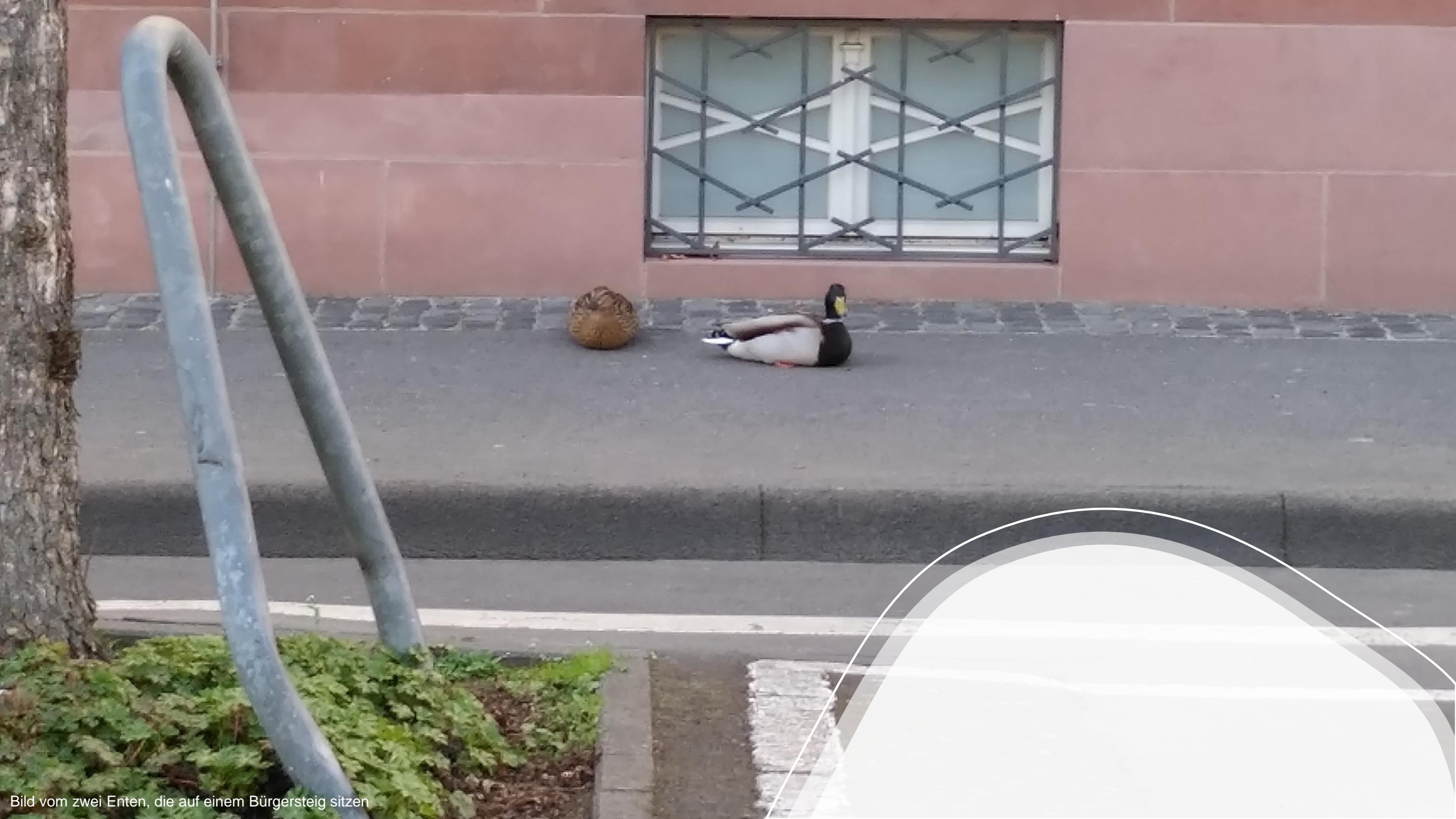
Bild vom zwei Enten, die auf einem Bürgersteig sitzen