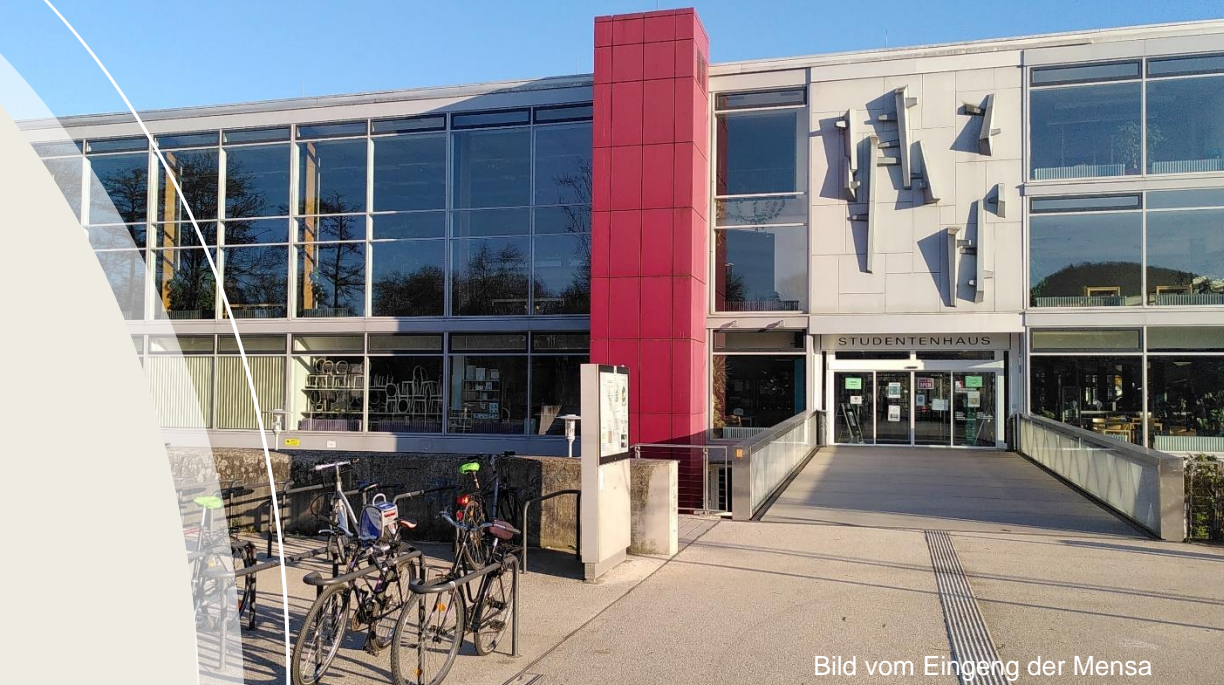
Bild vom Eingang der Mensa