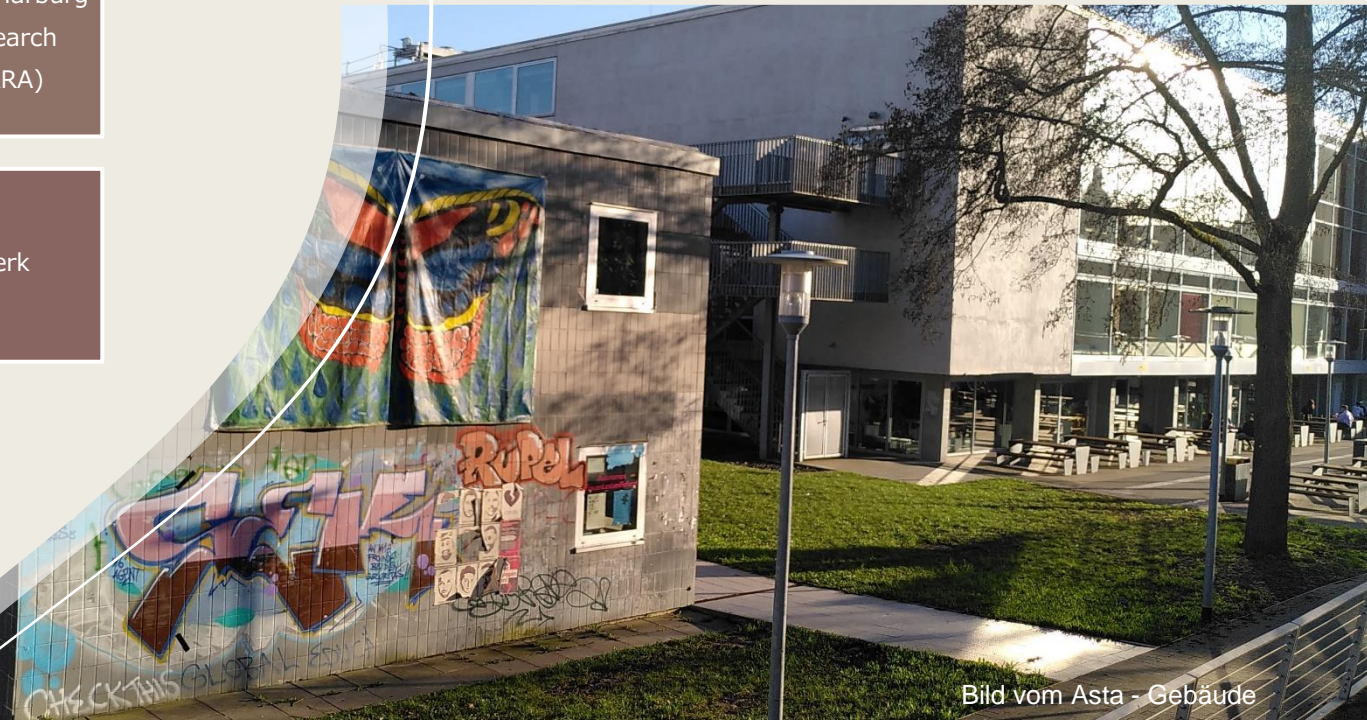
Bild vom Asta - Gebäude