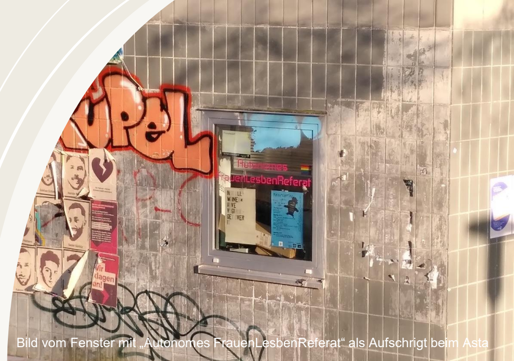
Bild vom Fenster mit „Autonomes FrauenLesbenReferat“ als Aufschrift beim Asta