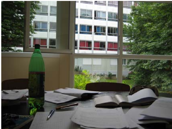
Sale de travail im Wohnheim