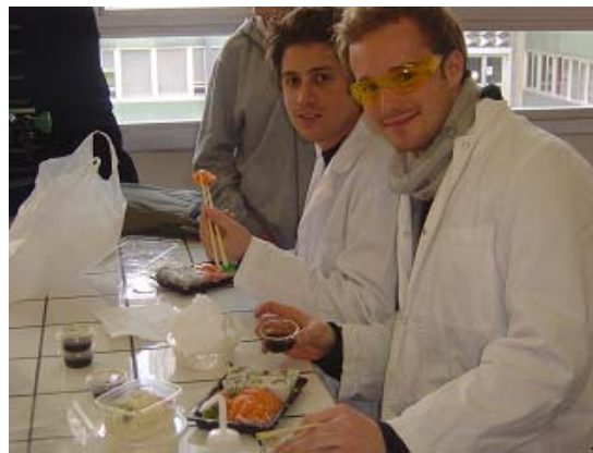
Na wer isst denn da im Labor?! Bon Appetit les gars!