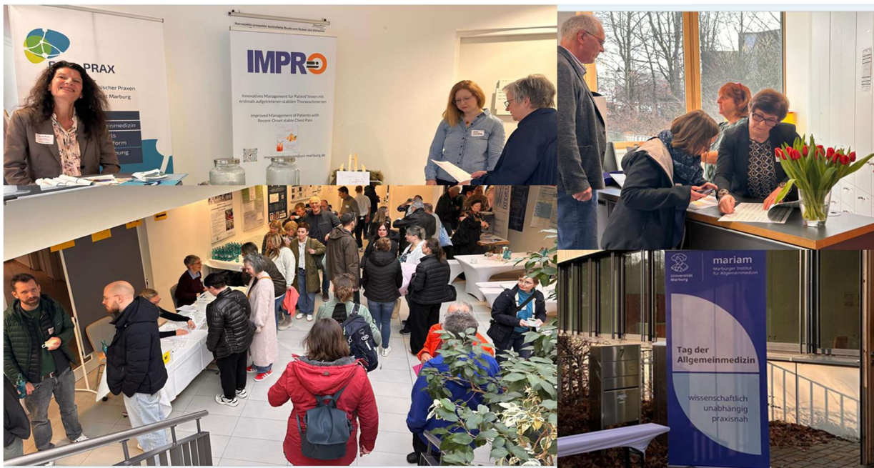
Rund 200 Teilnehmende waren auf dem 19. Tag der Allgemeinmedizin im Maris zu Gast

Am 4. März 2026 fand im Maris der 19. Tag der Allgemeinmedizin des Instituts für Allgemeinmedizin der Philipps-Universität Marburg statt. Das bewährte Fortbildungsformat bot hausärztlichen Praxisteams erneut ein abwechslungsreiches Programm aus praxisnahen Workshops und wissenschaftlichen Impulsen.