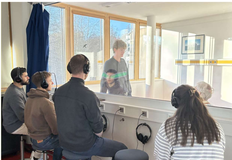
Studierende trainieren Gesprächsführung im geschützten Rahmen mit Simulationspersonen, Foto: Kerstin Thies