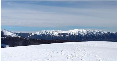
Wunderschön und absolut zu empfehlen: eine Schneeschuhwanderung (ciaspolata) in den Apenninen

ECTS an Veranstaltungen belegt habe und andererseits daran, dass ich alleine gewohnt habe und