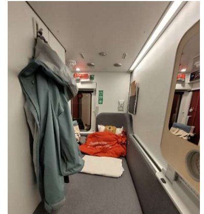
Hin- und Zurück fuhr ich mit dem Nightjet in der Mini-Cabin

von etwa 08:00-13:00 und dafür gab es einen ECTS-Punkt. Einige Dozierende haben auch in ihrer Vorlesung angeboten, dass man bei ihnen Praktika machen kann und dann war die Organisation ein bisschen leichter. Generell stand ich bei den Praktika viel an der Seite und habe den Ärztinnen über die Schulter geschaut, aber ich hatte auch Kontakt mit italienischen Studierenden. Wenn man Eigeninitiative ergreift, ist ziemlich viel möglich und ich konnte z.B. während meines Gynäkologie-Praktikums auch einen Kaiserschnitt sehen.