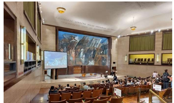
Einführungsveranstaltung in der Aula Magna

Nach der Zusage hatte ich etwa ein halbes Jahr für die Vorbereitung des Aufenthaltes, also Learning Agreement erstellen, Zimmer finden etc. Ich wollte entweder Veranstaltungen der Gyn-Päd-Kohorte oder von Kopf-Hals belegen. Da die Pädiatrie-Vorlesung und die Gynäkologie-Vorlesung im Wintersemester angeboten wurden, entschied ich mich diese zu