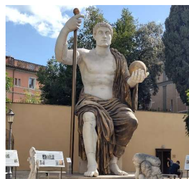
Das gehört auch zu Rom: riesige Skulpturen, hier im Hinterhof der Musei Capitolini

Sport (Volleyball und Fußball) angeboten. Ich habe mich bei ESN (Erasmus Student Network) Rom angemeldet. Es gibt auch noch andere Veranstalter, wie z.B. die ERA – Erasmus Rom Association.