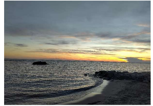
Sonnenuntergang in Ostia, das Meer ist mit der Metromare nur eine halbe Stunde vom Zentrum entfernt

Vor meinem Erasmus hatte ich einen recht „rosaroten“ Blick auf Erasmus und von vielen wurde mir gesagt, dass es die beste Zeit meines Lebens werden wird. Diese hohe Erwartungshaltung konnte bei mir nicht erfüllt werden, wodurch ich von meinem Erasmus auch enttäuscht war und dies keineswegs als entspannteres Semester genießen konnte. Dies lag einerseits daran, dass ich 30