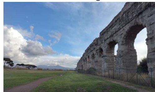
im Parco Appia Antica finden sich Überreste eines historischen Aquäduktes

zwischen römischen Uni-Ruder-Teams teilnehmen.