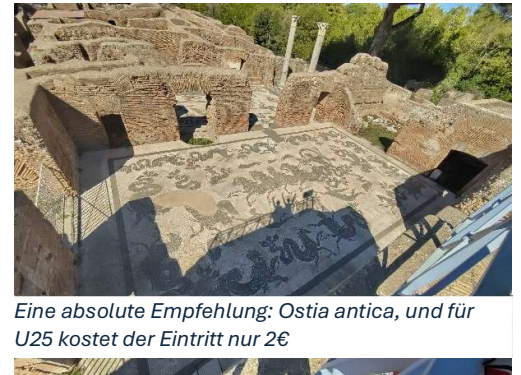
Eine absolute Empfehlung: Ostia antica, und für U25 kostet der Eintritt nur 2€

Dennoch hatte mein Erasmus auch positive Seiten und ich habe die italienische Lebensart mit Caffè für 1€ und günstigen Besuchen in Museen auch sehr genossen.