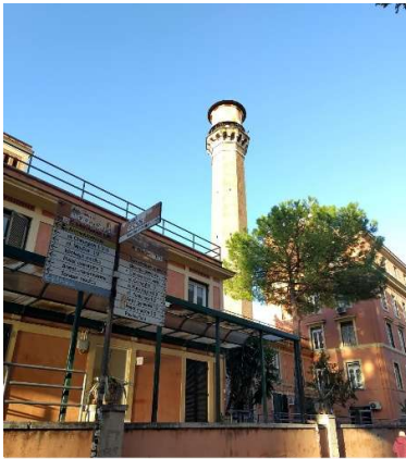
Charakteristisch sind im Policlinico die vielen Wegweiser

welche aus dem 6. Studienjahr zu belegen, was sich aber überschritten hätte). Generell wurden an der Sapienza keine Seminare angeboten. Bei den Vorlesungen gibt es theoretisch eine Anwesenheitspflicht von 70%, die aber nicht regelmäßig kontrolliert wurde (nur einige Profs waren dann wütend, wenn statt 200 Studierenden nur 15 anwesend waren). Für die Praktika wurden mir Empfehlungsschreiben von meinem RAM ( responsible of academic mobility , also meinen fachlichen Ansprechpartner von der Sapienza) ausgestellt, mit denen man dann Ärzte angeschrieben und gefragt hat, ob man in ihrer Abteilung ein Praktikum machen kann. Die Praktika gingen jeweils eine Woche