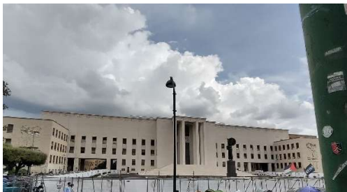
Das Hauptgebäude der Sapienza