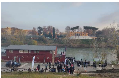
Bei der Regatta am Tiber

habe ich gelesen, dass ein früheren Erasmus-Student aus Marburg in Rom Kanu gefahren ist. Das führte mich dazu, auch Rudern in Rom fortsetzen zu wollen. Nach langer Organisation um die Anmeldung: ich lernte, dass die Sapienza kein Ruder-Team, aber dafür ein Kooperation mit der Università del Foro Italico hat, konnte ich ab November 2025 auf dem Tiber zwei Mal die Woche rudern. Das gehörte mit zu sehr glücklichen Momenten in Rom und im Dezember konnte ich sogar an einer inter-universitären Regatta