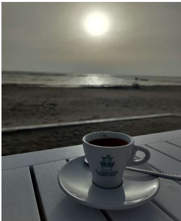
Caffè gibt es günstig, hier am Strand in Ostia

Zur Wohnungssuche: diese gestaltete sich als schwierig und zeitintensiv, da ich mir als Budget max. 600€ Miete im Monat gesetzt hatte und gerne ein Zimmer für mich alleine gehabt hätte. Es gibt zwar viele Angebote, aber auch sehr viele Interessenten für die günstigen Zimmer und viele Vermieter bevorzugen Mieter, die länger als ein Semester da sind. In den Univierteln San Lorenzo, Bologna und Policlinico gibt es auch viele Vermieter, die sich auf Erasmusstudierende „spezialisiert“ haben, aber dann oft viel Miete verlangen. Außerdem wohnt man in vielen Wohnungen schwarz, also ohne Vertrag und einige meiner Freunde mussten ihre Miete bar bezahlen. Ich hatte das Glück, dass ich über einen Kollegen von Freunden eine Unterkunft gefunden habe.