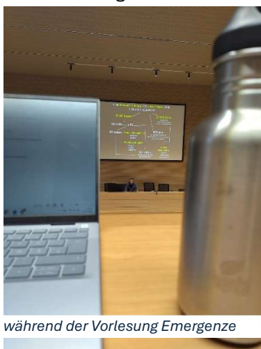
während der Vorlesung Emergenze

belegen. Zusätzlich wollte ich Praktika/ Unterricht am Krankenbett machen. Um auf 30 ECTS (oder auf Italienisch CFU) zu kommen, entschied ich mich einen extensiven (also semesterbegleitenden) Italienisch-Sprachkurs zu belegen und eine Vorlesung in Notfallmedizin zu besuchen. So in dieser Form habe ich das Learning Agreement in den ersten Wochen meines Aufenthaltes erstellt. Für das Einreichen des ersten Learning Agreements empfiehlt es sich möglichst Veranstaltungen aus einem Jahr zu belegen (ich hatte zuerst überlegt, Veranstaltungen aus dem 5. und