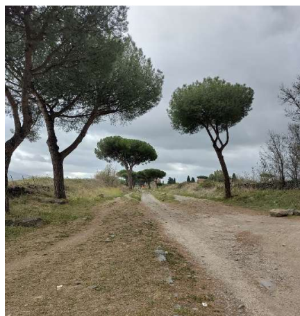
Toll zum Wandern und holprig beim Fahrradfahren: Die Via Appia Antica

Semesterticket gibt es leider nicht). In Bus, Straßenbahn und Metro ist es zu Stoßzeiten sehr voll und deshalb auch kaufte ich mir ein Fahrrad a seconda mano (also aus zweiter Hand). Durch das Fahrrad halbierte sich die Zeit für viele meine Strecken und ich habe mich relativ sicher gefühlt, auch wenn ich als Fahrradfahrerin im Straßenverkehr mehr aufpassen musste.