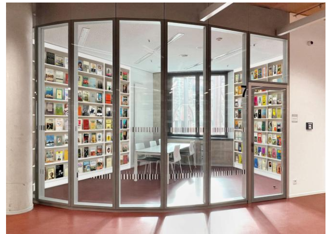
Bilder: Daniela Comani und VG Bild-Kunst Bonn

Die Installation lädt dazu ein, gewohnte Lektüren und die scheinbare Selbstverständlichkeit des literarischen Kanons zu hinterfragen. Welche Veränderungspotenziale ergeben sich für die Geschichtsschreibung, ihre Zuordnungen, Klassifizierungen, ihre Genealogien? Wer kommt als Protagonist*in vor, wessen Geschichten werden erzählt, und welche Stimmen fehlen bis heute in den Regalen?