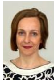
Prof. Dr. Korn Mitglied des Direktoriums