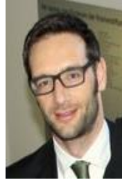
Prof. Dr. Rapp Law and Economics Corporate Governance Empirische Kapitalmarktforschung Anreizsysteme