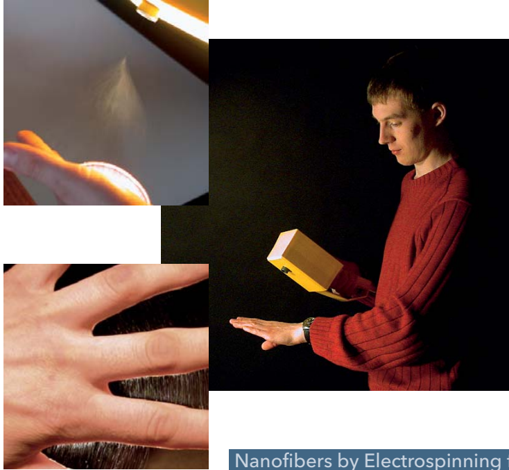
Deposition of electrospun fibers directly on human skin

Für den Einsatz als Wundverband werden resorbierbare Kunststoff- oder Biopolymernanofasern, gegebenenfalls mit wundheilenden, antiviralen, bzw. antibakteriellen Wirkstoffen ausgerüstet und direkt auf Wunden aufgebracht. Ziel ist der optimale und rasche Wundverschluss durch Abwehr von viralen oder bakteriellen Erregern einerseits bei gleichzeitigem atmungsaktiven Wundverschluss.