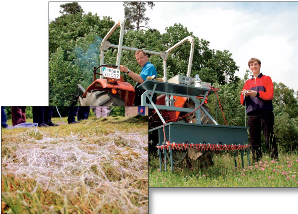
Plant protection by pheromone loaded nanofibers

Nanofasern auf der Basis von Kunststoffen, Biopolymeren, Metallen, Metalloxiden, Keramiken und Glas können durch Electrospinning hergestellt werden, dass bereits auch technisch erfolgreich eingesetzt wird. Die Vielfalt der möglichen Kombinationen und Funktionalisierungen von Materialien, die Gestaltungsmöglichkeiten bei den Faserstrukturen und die damit einstellbaren Eigenschaftskombinationen erlauben zahlreiche Anwendungen. Beispiele, die z.T. bereits technisch realisiert sind, sind die Ausrüstung von Filtern, Textilien, Sensoren, Katalysatoren, der Einsatz im Pflanzenschutz, zur Medikamentenfreisetzung oder in der regenerativen Medizin.